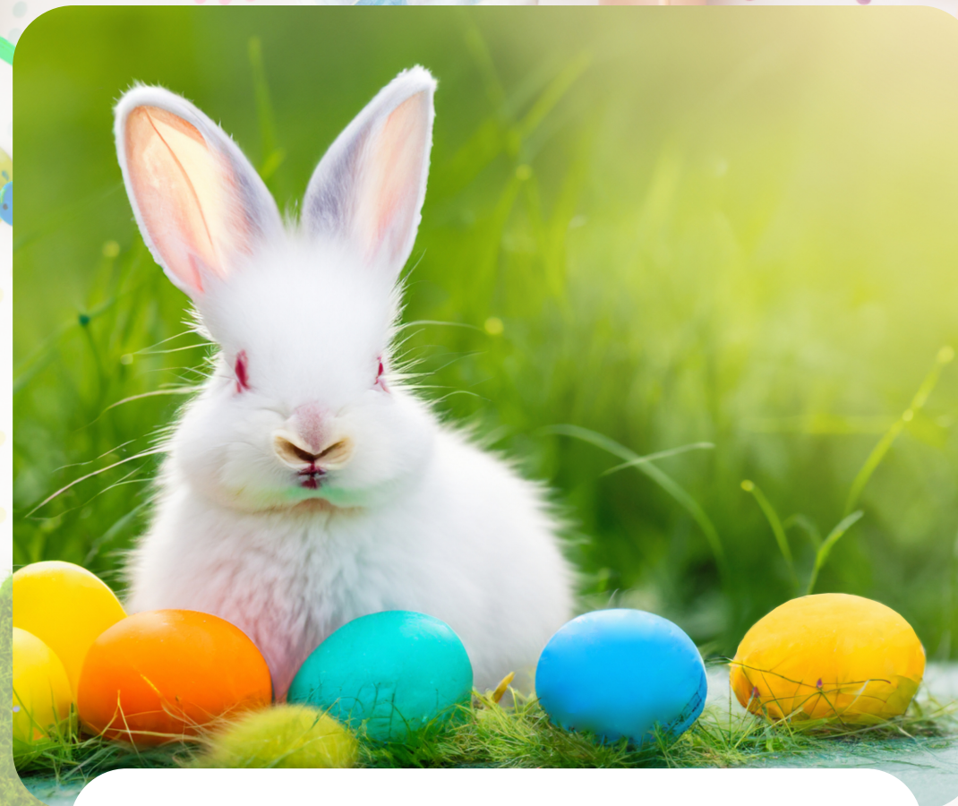
Easter Rabbit / Cwningen Pasg