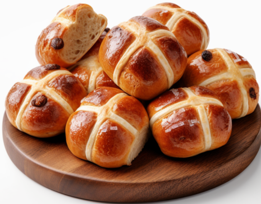
Hot Cross Buns / Teisen y Groglith

Print two copies and create your own Easter pairs game. Printiwch dwy gopi i greu gêm parau Pasg eich hun.