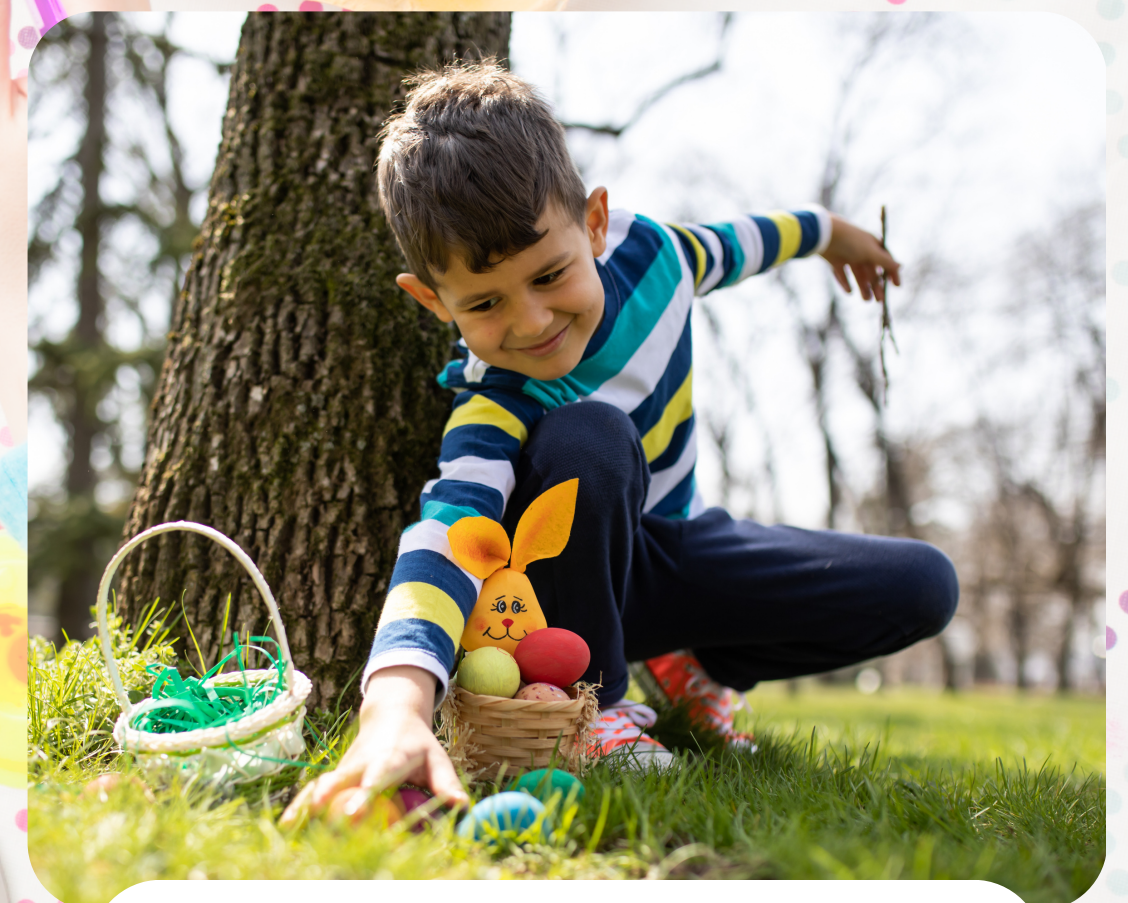
Easter Egg Hunt / Helfa Wŷ Pasg