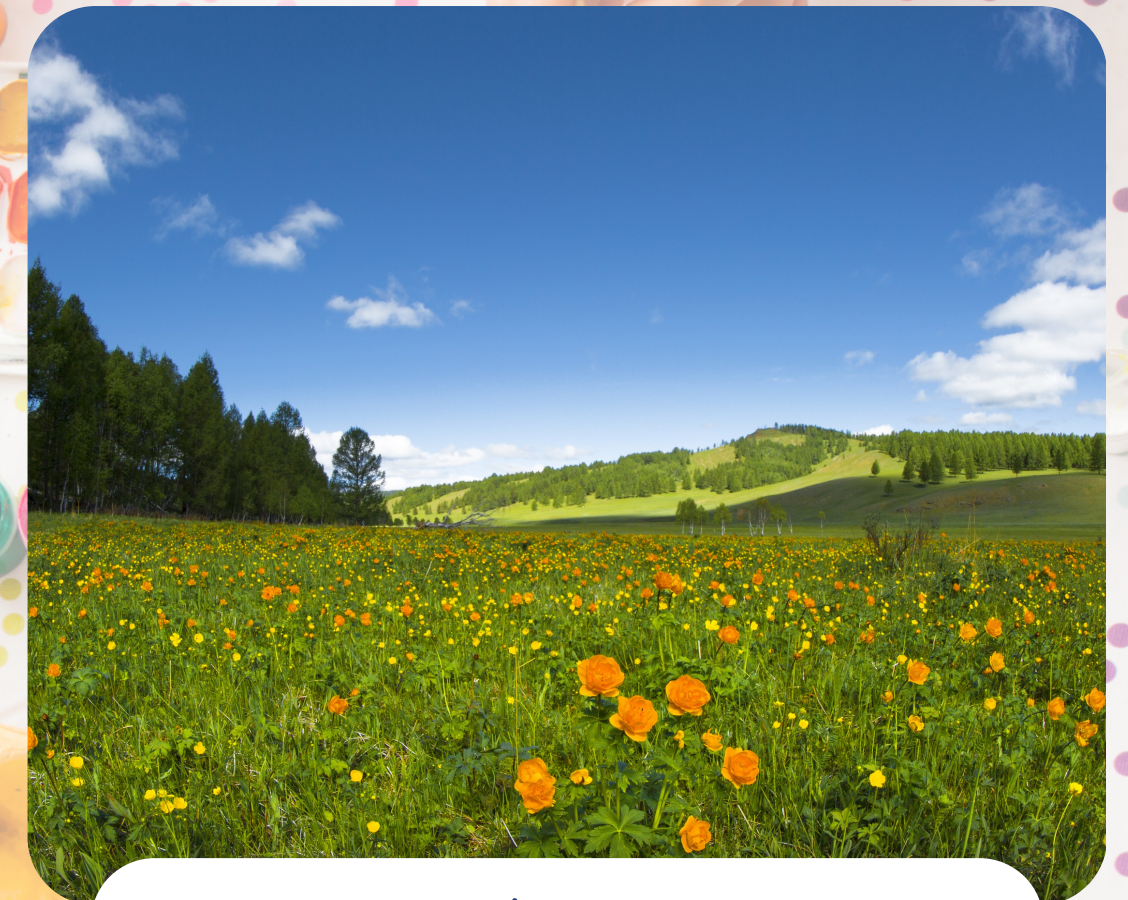
Spring / Y Gwanwyn