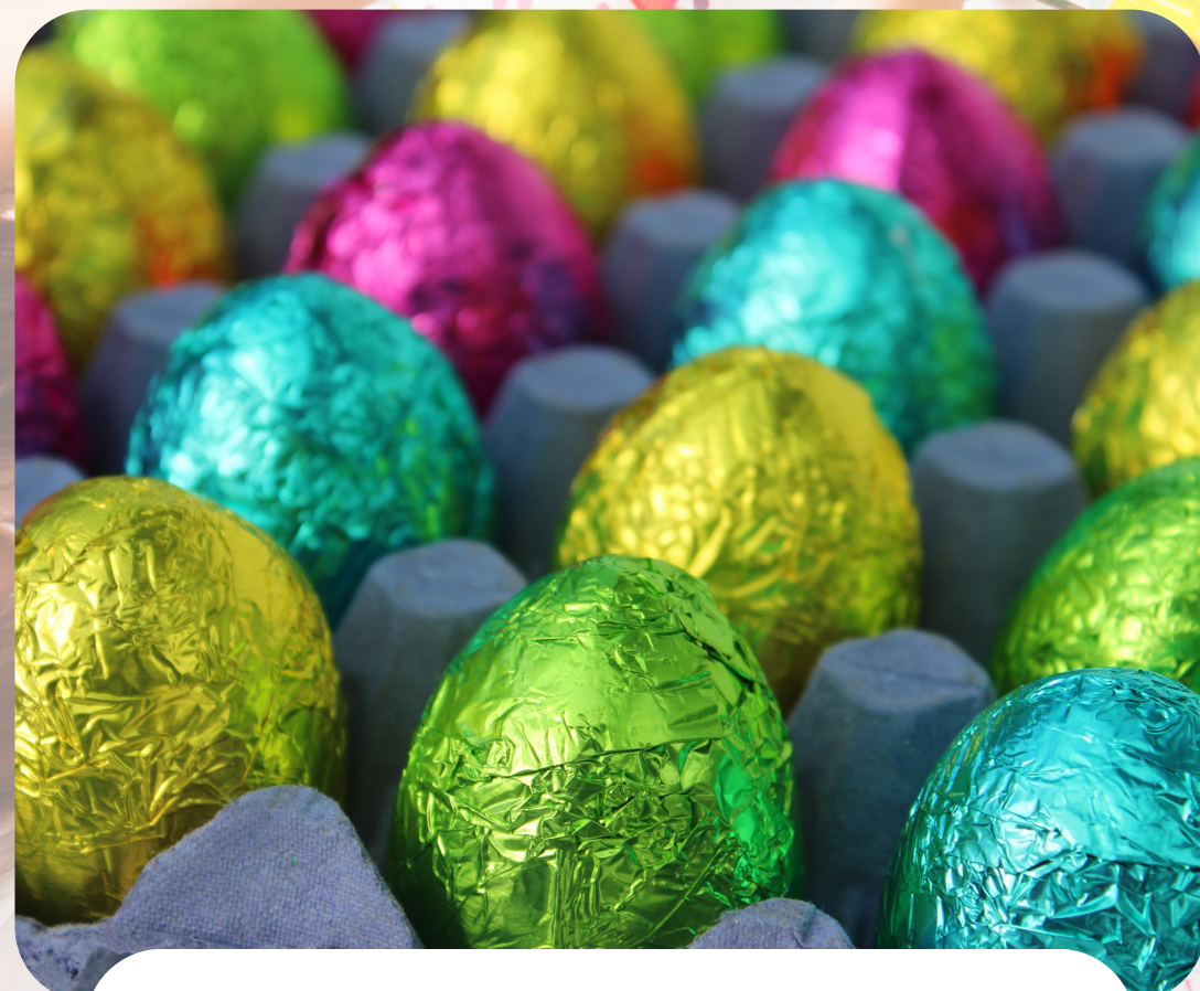
Chocolate Eggs / Wŷau Siocled