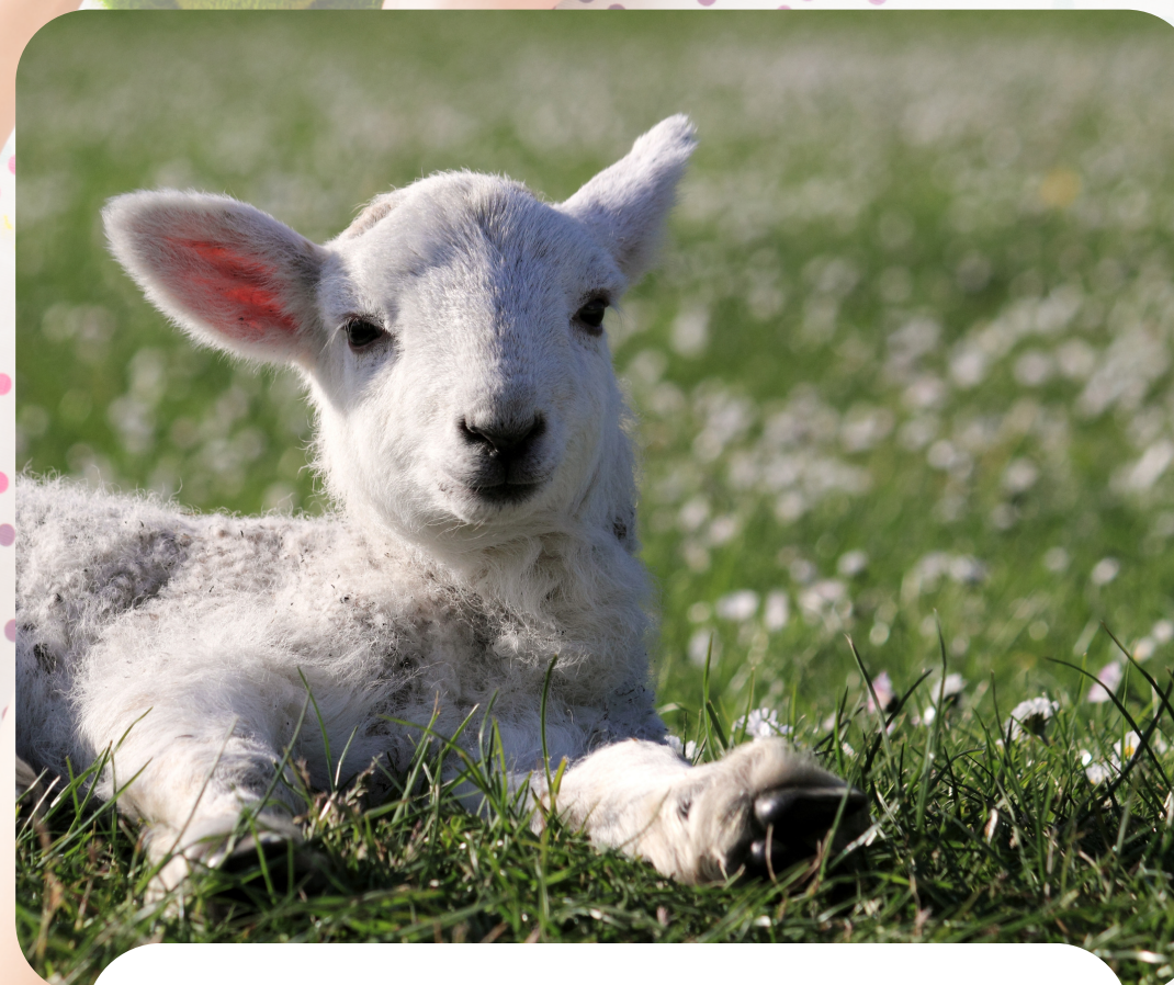
Lamb / Oen