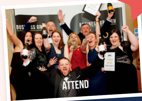
Enillwyr Gwobrau Twf Busnes

Cafodd y cwmni hefyd statws Arweinyddiaeth Cyflogwr Chwarae Teg oddi wrth Chwarae Teg yn 2019 ( https://chwaraeteg.com/prosiectau/cyflogwr-chwarae-teg/ )